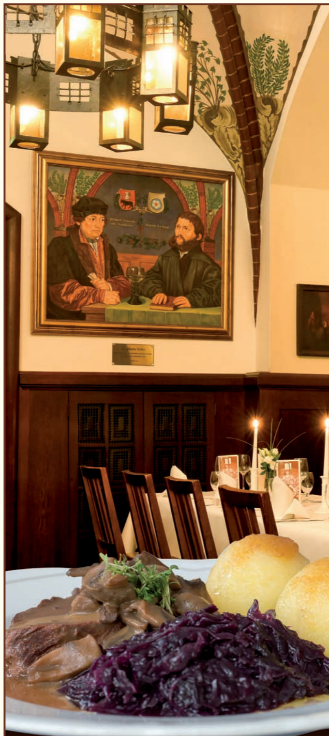
Lutherstübchen in Auerbachs Keller Leipzig

E chten Lutherfans möchten wir zudem einen Ausflug über die Stadtgrenze hinaus empfehlen: Im nur 35 km entfernten ehemaligen Zisterzienser-Kloster »Marienthron« zu Nimbschen (bei Grimma), wo sich die Mulde sanft durch idyllische Auenwälder schlängelt, laden die alten Klosterruinen und eine neue, liebevoll hergerichtete Hotelanlage zum Verweilen ein. Luthers Ehefrau, Katharina von Bora, verbrachte einst ihre Kindheit und Jugend hier, bevor Sie 1523 mit elf weiteren Nonnen aus dem Kloster floh und in Wittenberg Obdach fand. Beim »Original Nimbschener Luther-Menü« lässt man hier Geschichte lebendig werden. Zu rustikalen Speisen wird im historischen Gewand und in lustiger Manier von Dr. Martin Luther und Katharina von Bora erzählt. s.h. 6