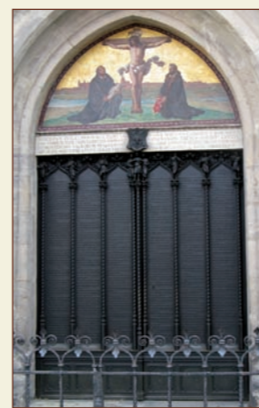
Die »Thesentür« in Wittenberg