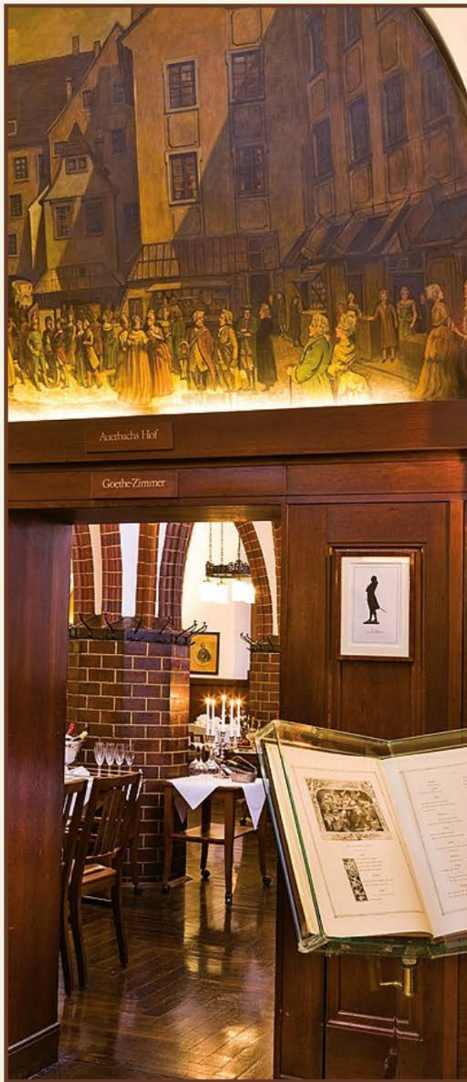
Historische Weinstuben - Blick ins Goethe-Zimmer